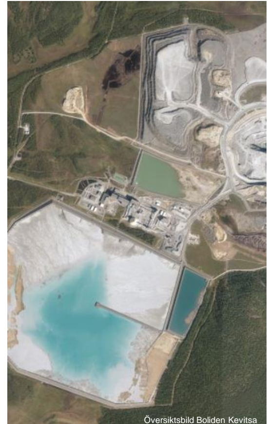
Översiktsbild Boliden Kevitsa