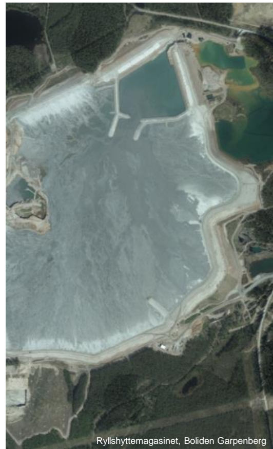
Ryllshyttmagasinet, Boliden Garpenberg